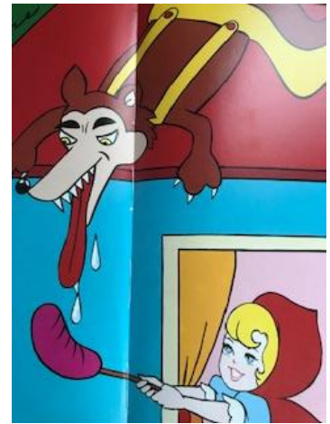
【図2 湯村タラ絵 武井訳11】

1991年の武井訳㉑の絵本では湯村が赤ずきんを青い服に赤いマントというスーパーマンを思わせる衣装で描いている。話の筋はグリム版に添っているが、表現には変更や簡潔化が施されている。母親は道草のみを注意し、祖母の異常を確認する娘の質問は「耳目口」(手が欠如)の3箇所についてだけである。狼は赤ずきんを食べてから、デザートとしてケーキを食べワインを飲む。狩人は赤ずきんの帽子が床に落ちていたので、狼が娘を食べたと確信し、ハサミで狼の腹を切る。娘と祖母を救出し、皆で石を詰めて祖母が縫う。石を詰められた狼は死なずに森へ帰る。数日後、赤ずきんは同じ狼に出会うが、口を利かず祖母の家に直行する。戸が施錠されていたので、狼は屋根で待つ。祖母がソーセージを焼いて、赤ずきんがそれを棒の先につけて窓から突き出す。狼はそれを食べようとして首を伸ばし、水桶の中に落ちる。生死は不明である。原典では狼をおびき寄せるのは「ソーセージのゆで汁」だが、ここではソーセージそのものである。それを棒につけて窓から屋根に差し出す赤ずきんの勇姿がスーパーマンを想起させる衣装で描写されている。特筆すべきは、後日談を分けず連続した話として描いている点である。石を詰められた狼は生き延びて再び娘と出会うが、学習した娘と祖母にやり込められる。原典では狼は溺死するが、ここでは狼の生死は不明である【図2】。