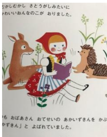
【図8 すぎうらさやか絵文 65】

2009年のすぎうらさやか文／絵の本 65 では、救済者が針鼠である。針鼠のハローとハリーが狼の腹を鋏で切り、2人を救出する。ハリーが腹に潜り込ん【図7 ジョナサン・ラングレイ絵・文 24】で暴れると、狼は痛がってハリーを吐いて逃げ出し、二度と娘に近寄らない。救出者を人間の男から針鼠に変えた杉浦は「赤ずきん」が伝承文学であり、多くの異型があることを熟知している。「わたしは、ただただ『かわい