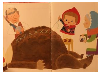
【図11 さこもみ絵 72】