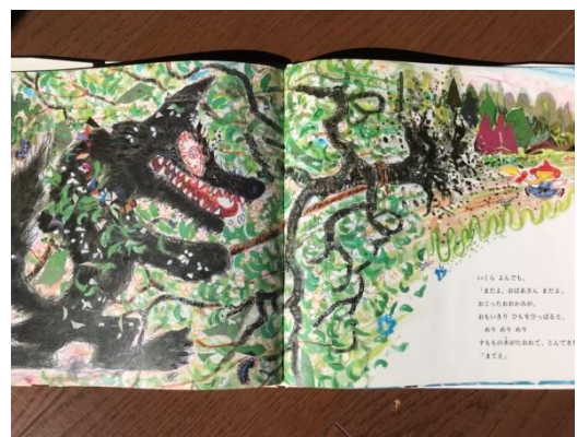
【図9 片山健絵 樋口淳文 14】

平成期に出版された「赤ずきん」は、ペロー版は少なく、グリム版のものが圧倒的に多い。原典に忠実な訳もかなり存在するが、自由に書き変えたパロディー調のものも目立つようになる。漫画やアニメ調の絵本はコンパクト版で安価な値段で販売されているので、普及率が高いと思われる。注目すべきは、赤ずきんが祖母と結託して狼を石桶の中で溺れさせる後日談を紹介する絵本が出版されている点だ。この話は「強い男に守られる弱い女」という「近代のジェンダー観」を刷り込む役割を果たしていない点で注目に値する。しかし一方、紙芝居や学校劇の台本では歌いながら森を歩く「赤ずきんの歌」が作詞作曲され、可愛く明るく疑うことを知らない無垢な少女像が強調されている。