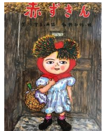
【図6 飯野和好絵 矢川訳43】

絵が強烈な印象を与えるのは天沼訳 51 で、大竹のファンタスティックアートの絵を見る者を釘付けにする【図5】。子ども向けに簡略化しながら擬声語を多用し、原作の要素を忠実に反映しているのは、1999年の立原訳 34 と、2018年の中脇訳 104 である。特筆すべきは、日本風に改変して人物を描いている2001年の矢川訳 43 である。飯野が赤ずきんや両親を日本の農民の姿にして描いている【図6】。2000年と2007年のいもと訳 36 では娘と祖母は腹から救出され、皆で狼の腹に石を詰めたときとされているが、絵には祖母が腹を縫う姿が描かれている。いもとの本は英訳され、英語版(2003年) 23 が出版されている。そこでは赤ずきんが石を詰めて縫う姿が描かれている。日本語版では祖母が縫い、英語版では幼女が縫う。同じ内容の話が異なった絵で表現されているのはなぜか、理由は不明である。