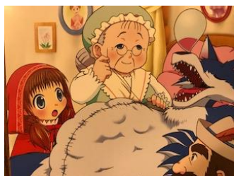
【図10 船道愛子絵 本上紙魚子文78】

友達になりたいという狼を登場させた作家の出現は、人権尊重の立場から見ると喜ばしい。しかし、同時に「未知の存在」に対する警戒心を子どもに抱かせないという欠点も持つのではないだろうか。