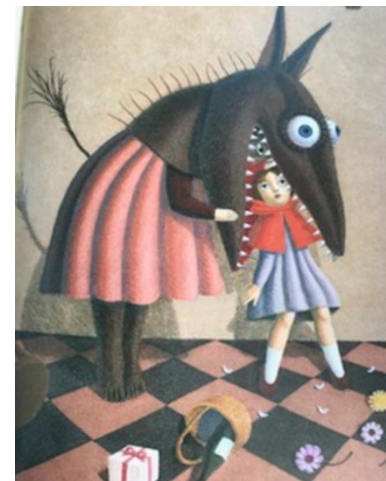
【図5 大竹茂夫絵 天沼訳51】

話の筋には忠実であるが、表現が簡素化されている本でグリム版と明記されているもの24冊 16 、明記されていないものが3冊 38,35,7 ある。簡素化されている箇所は、主として次の3点である。母親の5つの注意事項が「道草」のみになる点 17 、花摘みは娘が思いつくのだが、狼の提案になっている点 18 、腹から救出された祖母は瀕死の状態だったという記載がない点 19 、赤ずきんが石を集めて、皆で腹に詰めるという原典の表現は6冊のみで 20 、すべてを3人がしたり 21 、赤ずきんがしたり 22 、と様々に改変されている。