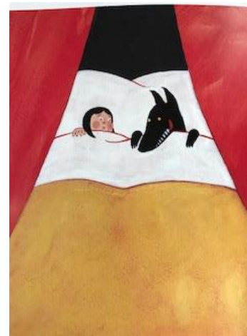
【図1 E・パトゥ絵 池田香代子訳 42】

(6) 2016 (平成 28) 年、シャルル・ペロー原作、山西和枝文のオペラ『赤ずきん』④はペロー版の出だしで始まるが、両者が救出される結末はグリム版に近い。異なるのは救出者が複数の猟師と樵で、赤ずきんが狼の命乞いをする点だ。腹を切られて改心した狼は、人間を襲わないと約束して幕が下りる。グリム版と大きく異なるグリム改作版といえる。