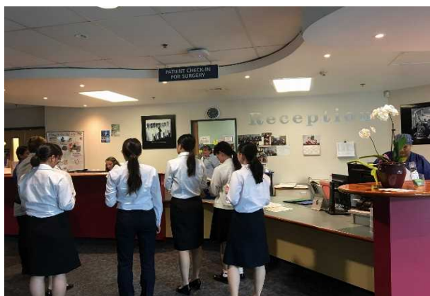
写真9 マヌカウスーパークリニック

6日目(2月24日)の午前は、Totara Hospice (トータラホスピス)の見学を実施した。トータラホスピスは、南オークランドエリアに位置した22床のホスピスである。入院場所は全て個室対応をしており、入院期間は1~2週間程度と短く、入院費用は寄付などにより賄われており無料とのことであった。がんの患者だけでなく、慢性疾患や難病の患者への対応、レスパイトケアへも対応がされていた。