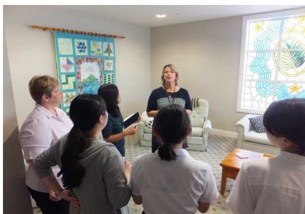
写真10 トータラホスピス

6日目(2月24日)の午前は、Totara Hospice (トータラホスピス)の見学を実施した。トータラホスピスは、南オークランドエリアに位置した22床のホスピスである。入院場所は全て個室対応をしており、入院期間は1~2週間程度と短く、入院費用は寄付などにより賄われており無料とのことであった。がんの患者だけでなく、慢性疾患や難病の患者への対応、レスパイトケアへも対応がされていた。