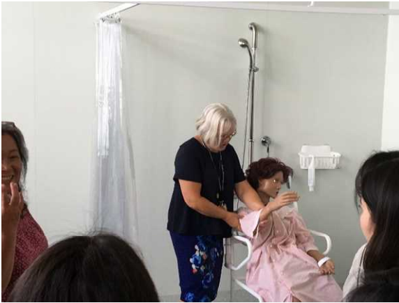
写真6 MITでの授業風景(看護演習室)