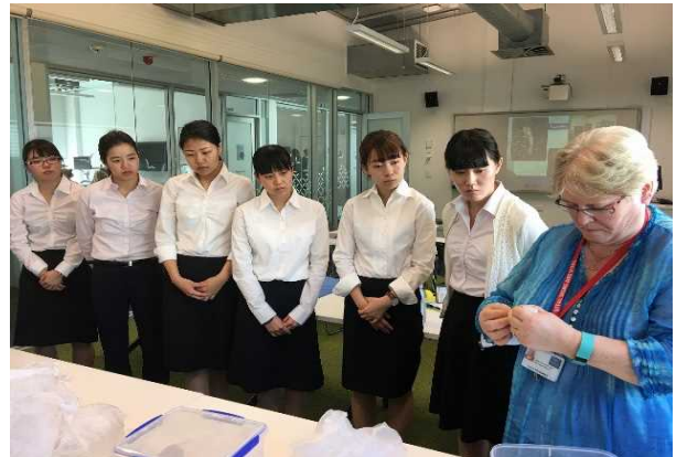
写真8 ミドルモア公立病院

5日目(2月23日)の午後は、Manukau Super Clinic(マヌカウスーパークリニック)の見学を行った。マヌカウスーパークリニックは、10のモジュールで編成された診療科を有しており、外来診療および日帰り手術を主とした公立の病院である。かかりつけ医であるGeneral Practitioner(一般開業医:GP)の紹介により専門医への受診や、事前に予約した手術を扱い、緊急の手術は行っておらず、ミドルモア公立病院と連携をとっているとのことであった。また、透析治療を行っており、午前中に約50名、多い時には1日180名の透